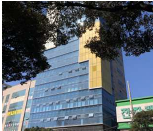
소셜캠퍼스 온 제주 외관